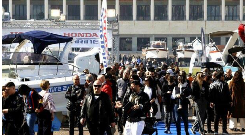
52° Nauticsud in programma alla Mostra d'Oltremare

Il salone nautico, primo evento del biennio 2026/2027 di promozione della città partenopea in vista della Coppa America è previsto da sabato 7 a domenica 15 febbraio.